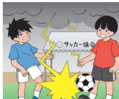
対象となる事故の例

被保険者が運営する競技大会での落雷事故により、参加者が傷害を負い、雷鳴を認識しながら大会を中断しなかったとして被保険者が損害賠償責任を負う場合