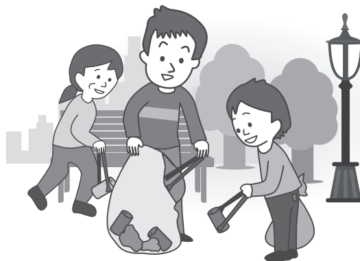
●ボランティア活動