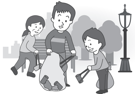
●ボランティア活動

「団体での活動中」に加え、自宅と活動場所との「往復途中」の事故についても補償されるため、文化活動、ボランティア活動、地域活動の団体・グループにも役立つ保険です。 メンバーの皆様が安心して活動が行えるよう、是非ご加入ください。