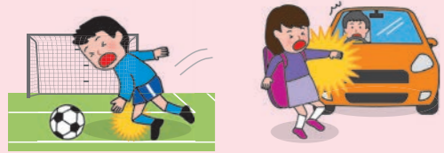
● 団体活動中のケガ ● 団体活動への往復中、車にはねられてケガをした場合

※AW・BW・CW区分にご加入の場合は、上記に加え、「団体での活動中およびその往復中」以外の事故も対象となります。ただし、熱中症、細菌性・ウイルス性食中毒を除きます。