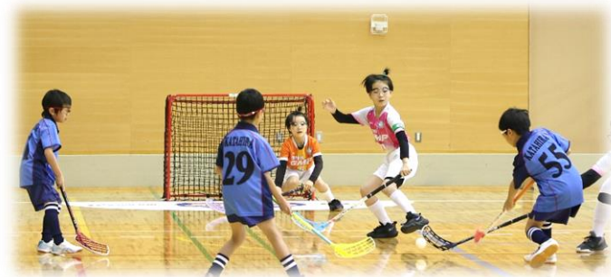
小学生低学年の部

幼児、青少年、社会人、現役を退いた高齢者の運動習慣の定着と健康の意識高揚を図るため、健康づくりのための生涯スポーツを自主的な地域活動を通して普及させたいと考えています。