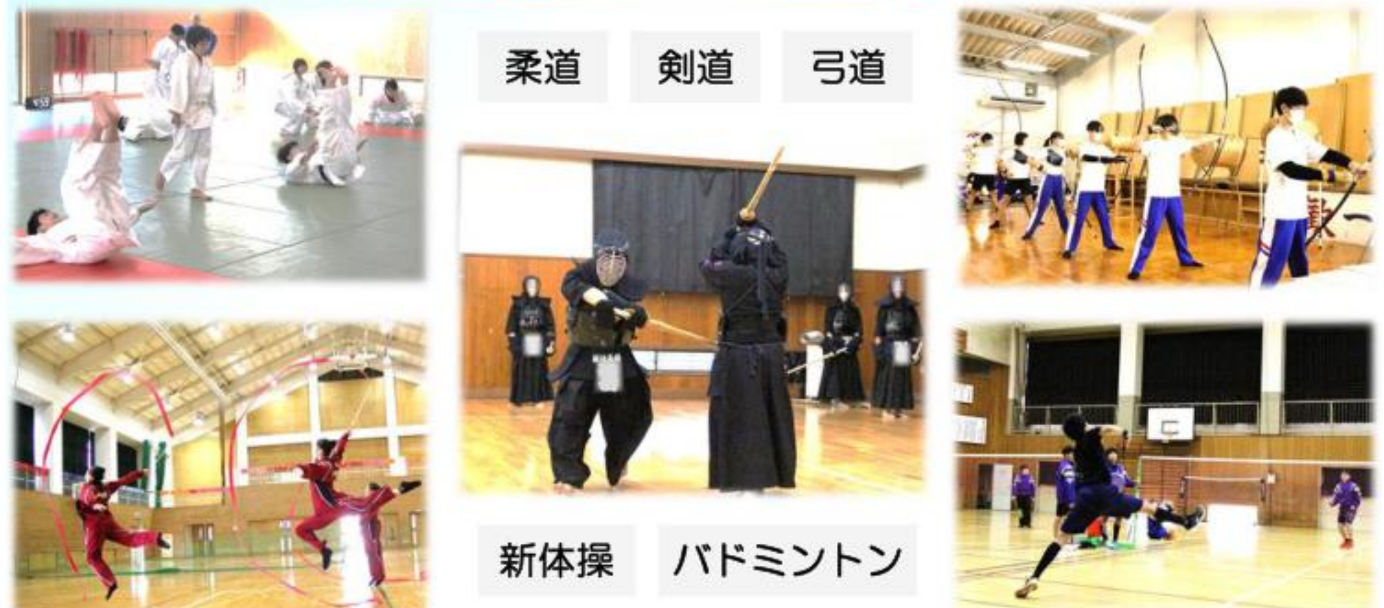
柔道 剣道 弓道