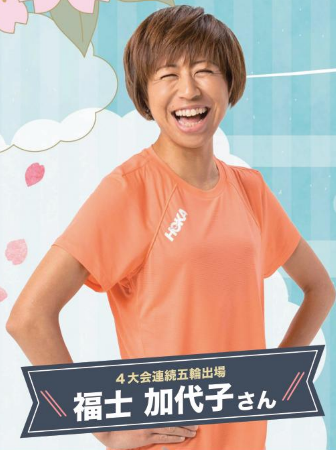
4大会連続五輪出場 福士 加代子さん