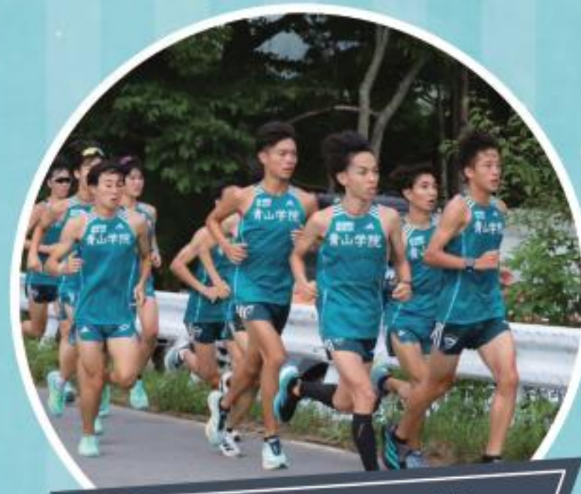
青山学院大学 陸上競技部